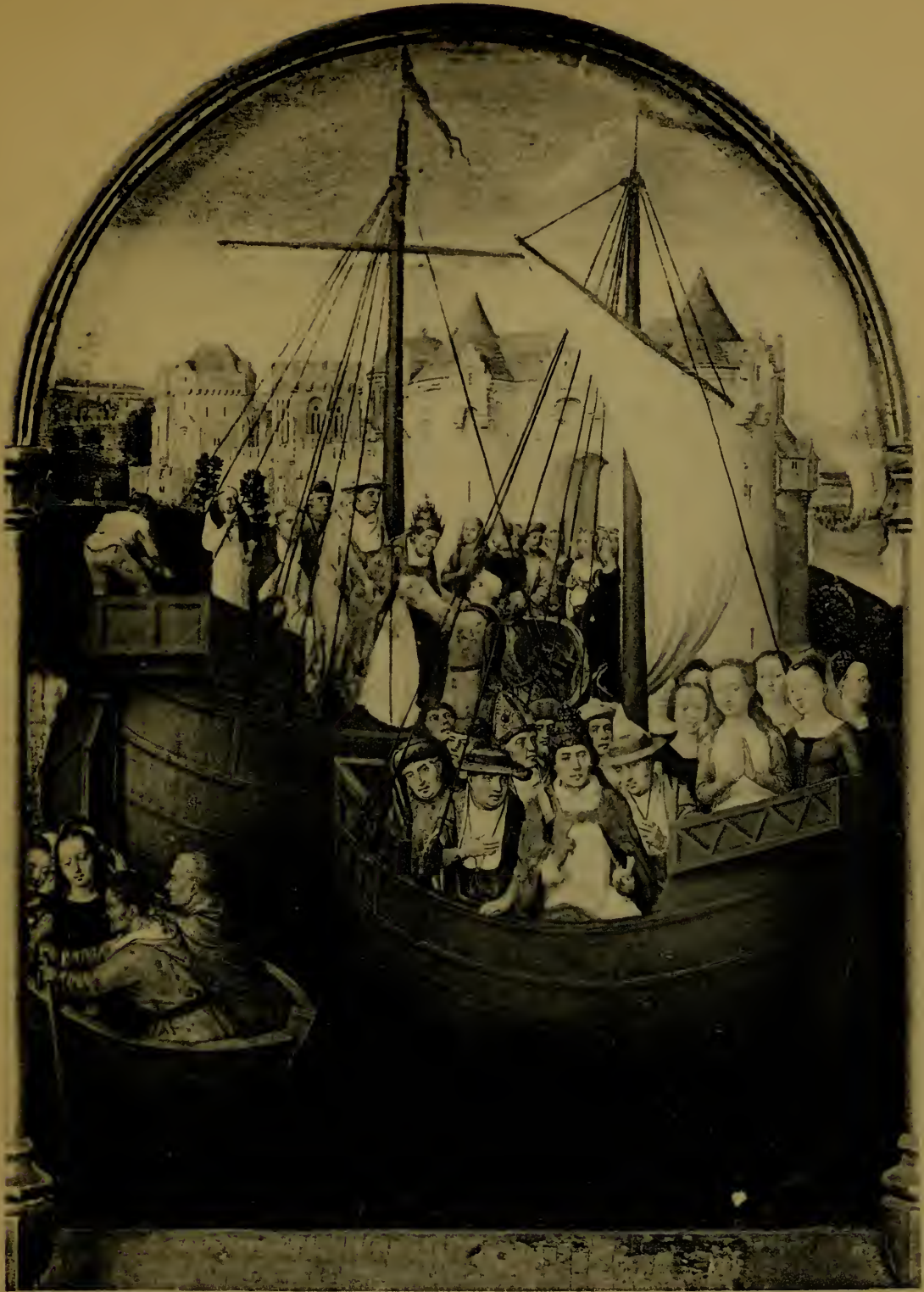
Le départ pour Cologne Quatrième panneau de la Châsse de Ste-Ursule.